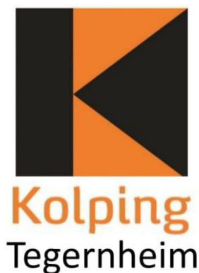
Design 1: Logo des Kolpingwerkes