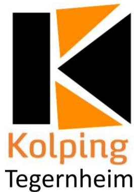
Design 2: Logo der Kolpingjugend