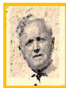
um ca. 1955

Diese beiden Veranstaltungen müssen wegen Corona entfallen