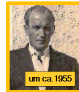
um ca. 1955