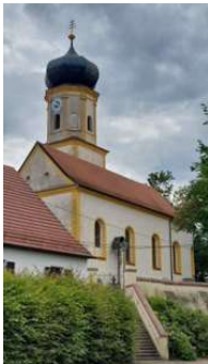
Kirche in Hellkofen