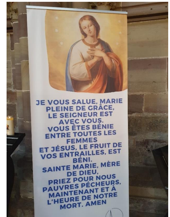
Madonnenbild im Straßburger Münster

1. Mai: Fest Maria Schutzfrau Bayerns: „Erhalte o Heilige Jungfrau deinen Bayern ihre Habe, ihre Verfassung, ihre Arbeit und ihre Religion.“ (Kurfürst Maximilian I.)