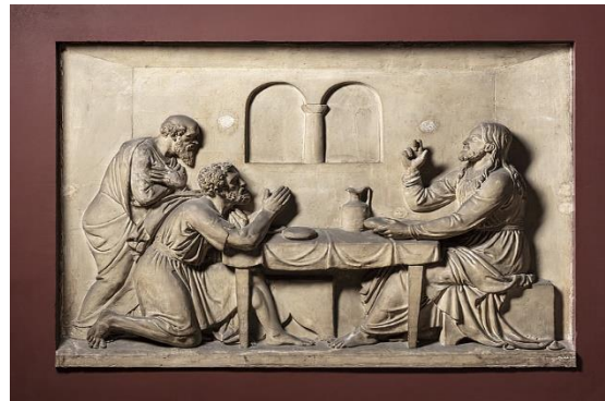
„Die Emmausjünger erkannten Jesus, als er das Brot mit ihnen brach“

bei der Aktion Palmsonntag: Basteln der Palmbüschel, Kleben der Palmkränzchen, Schmücken des Kreuzes, Basteln von Büscheln für Pfarrer und Ministranten. Wir konnten 525,75 € an unsern Pfarrer übergeben.