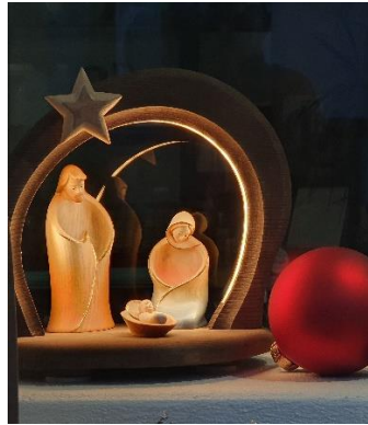
Regensburger Krippenweg 2023

O, lasst uns dieses Kindlein preisen, Das uns versöhnte mit dem Grab, Das uns das große Ziel der Weisen, Den Frieden und die Wahrheit, gab. Adolph Kolping