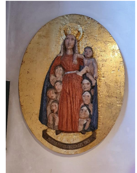
Schutzmantelmadonna in der St. Anna Kirche in Riedenburg

„Erhalte o Heilige Jungfrau deinen Bayern ihre Habe, ihre Verfassung, ihre Arbeit und ihre Religion.“ (Kurfürst Maximilian I.)